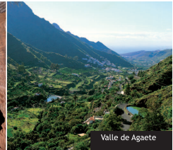
Valle de Agaete