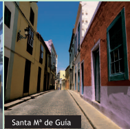
Santa Mª de Guía