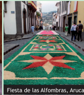
Fiesta de las Alfombras, Arucas