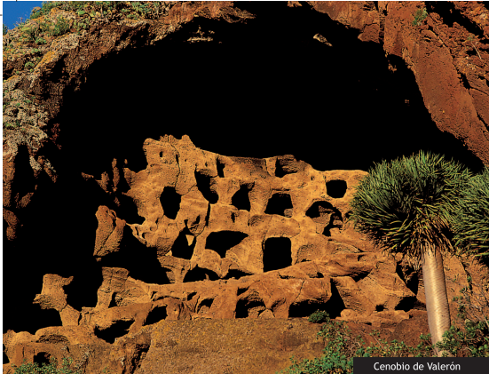
Cenobio de Valerón