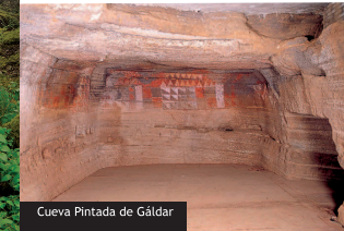
Cueva Pintada de Gáldar

Oficina información turística Avda. N. Sra. De las Nieves, 1 CP: 35480 - Agaete Tfno: 928 554 382 e-mail: turismo@aytoagaete.es www.aytoagaete.es